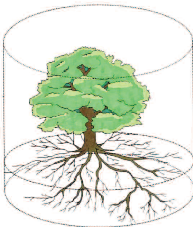
Illustration : Ophélie TOUZE

Méthode pour mesurer ce rayon : zone sensible mesurée avec l'application internet www.baremedelarbre.fr , ou à partir de la hauteur de l'arbre adulte (dans l'idéal) ou autres mesures à préciser.