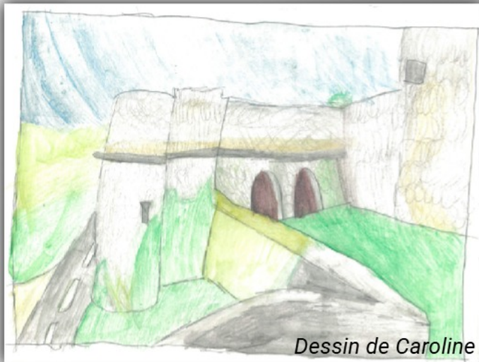
Dessin du château d'Argentonnay aujourd'hui