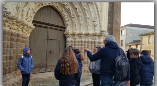
Texte et illustrations : Léo et Owen

Incendiée et ravagée à plusieurs reprises, elle subit plusieurs transformations. La dernière restauration importante date de 1963.