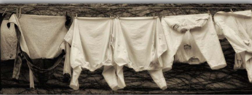
Linge ancien