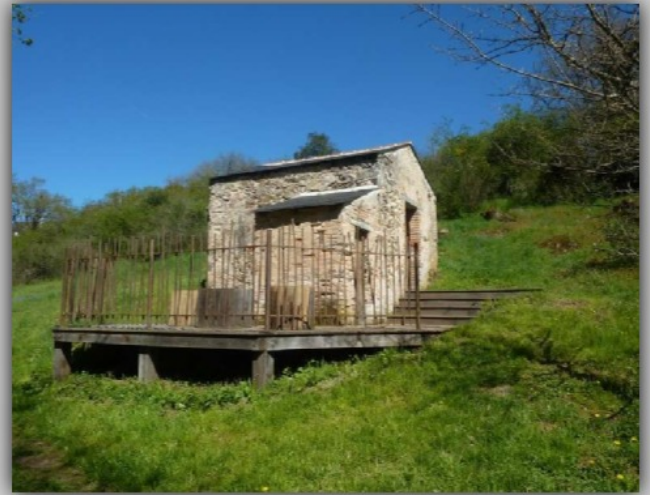
Clos de l'Oncle Georges-Argentonay