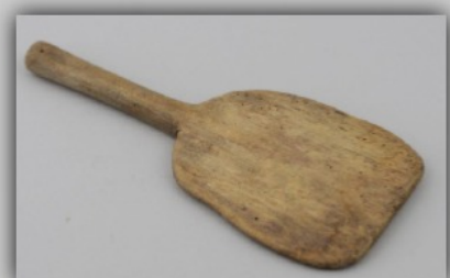
Battoir ancien