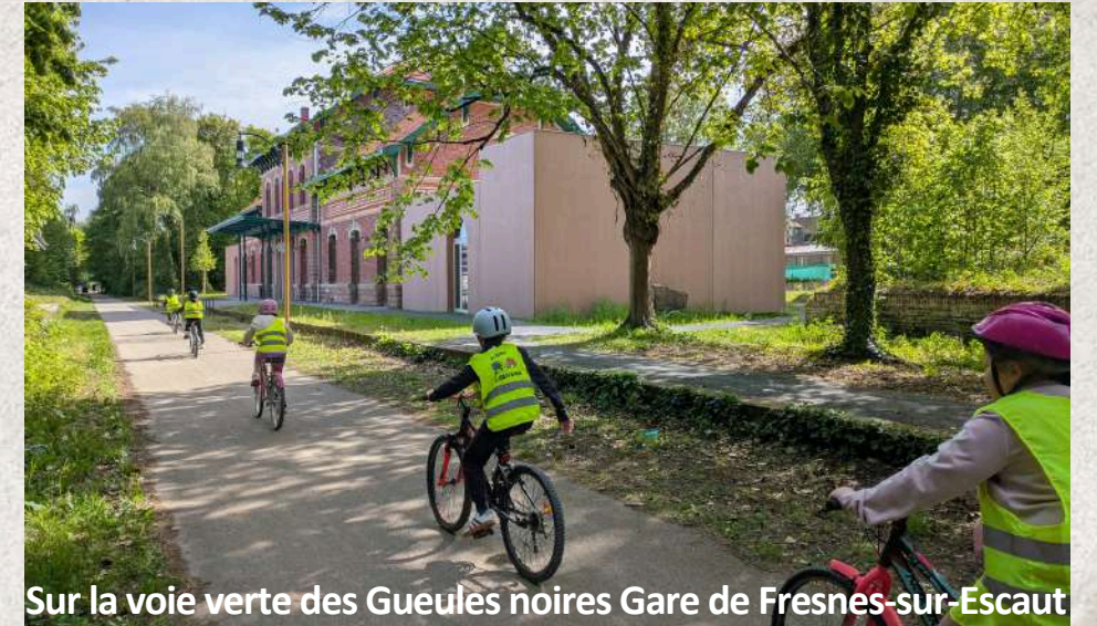
Sur la voie verte des Gueules noires Gare de Fresnes-sur-Escaut

Les mines du Nord ne sont plus en activité mais on voit encore des terrils, des chevalets et les corons des mineurs