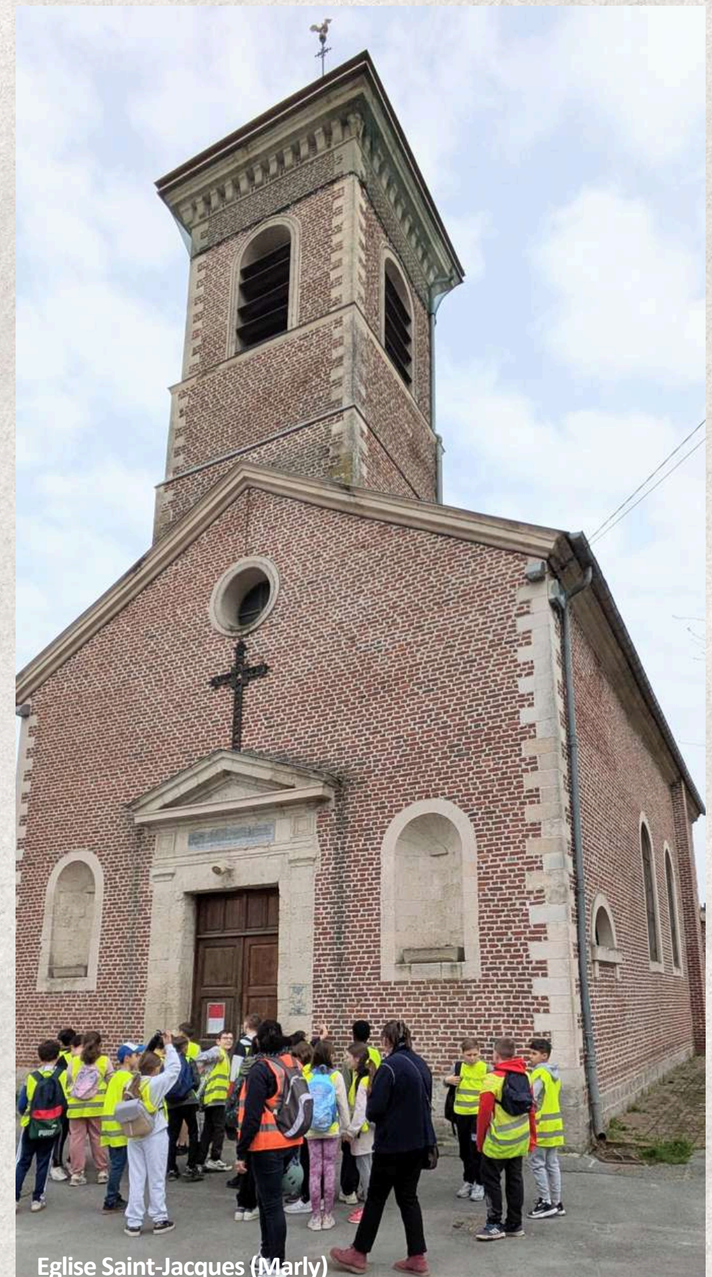
Eglise Saint-Jacques (Marly)

Nous avons également appris que Saint-Jacques est le Saint patron de la ville de Marly.