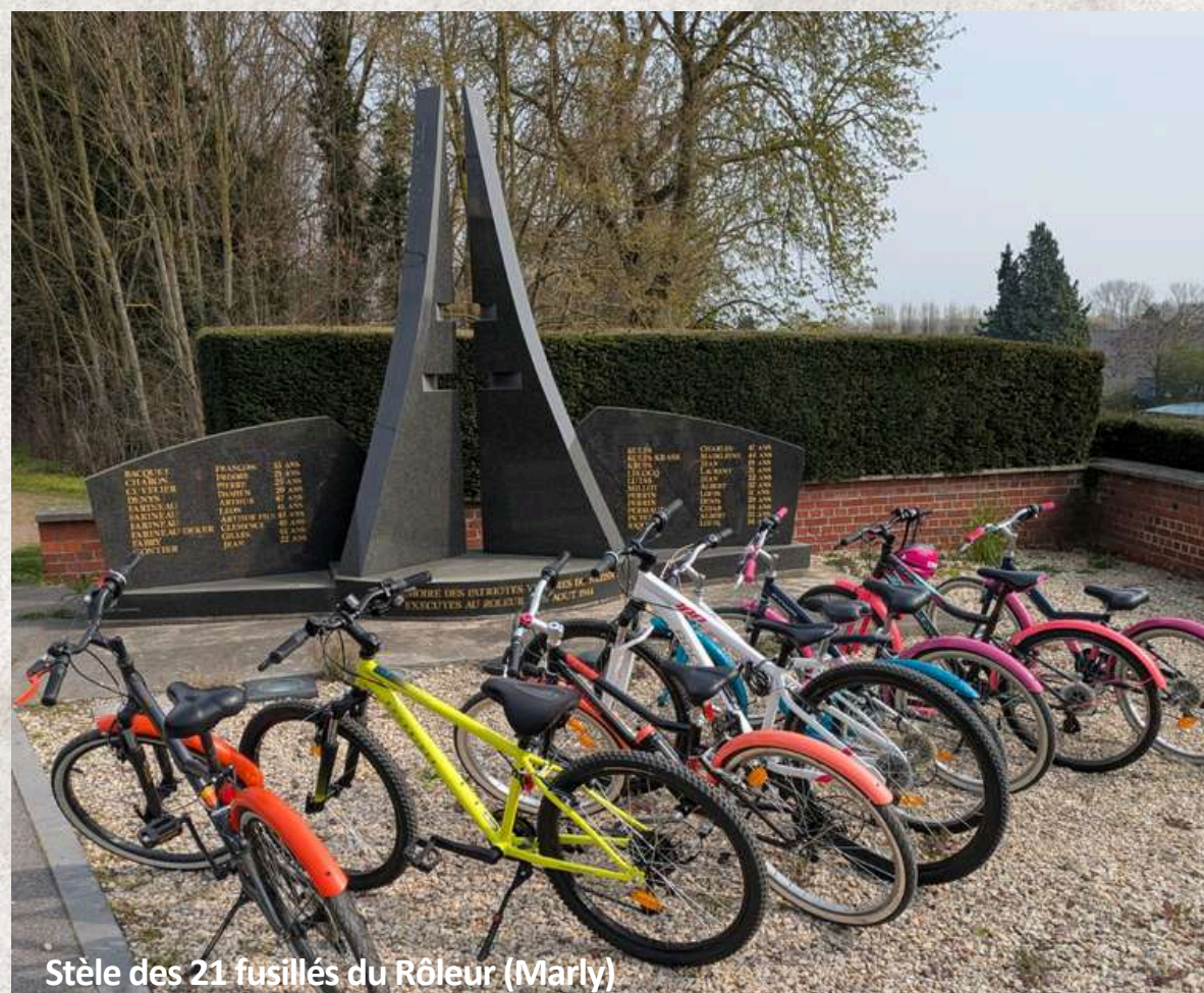
Stèle des 21 fusillés du Rôleur (Marly)