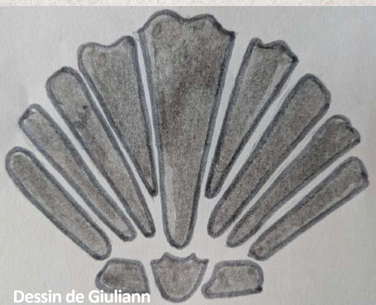
Dessin de Giuliani

Les chemins de Compostelle sont des itinéraires empruntés par les pèlerins pour se rendre à Saint-Jacques-de-Compostelle (Espagne).