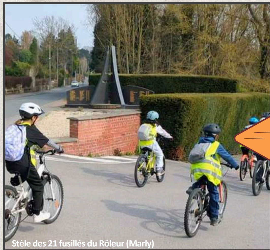
Stèle des 21 fusillés du Rôleur (Marly)

A bicyclette, les élèves de CM1-CM2 de l'école Marie Curie à Marly vous emmènent sur les routes et les chemins, à la découverte de leur territoire, entre histoire, mémoire et nature. Du moulin Souverain à l'église Saint-Jacques, du Musée de la Mémoire au site minier de Chabaud-Latour, ces petits explorateurs sont partis à la découverte de leur patrimoine local et ont dialogué avec celles et ceux qui font vivre ces lieux .