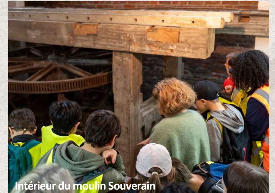
Intérieur du moulin Souverain

Une roue à aubes est une roue munie de pales qui fonctionnent grâce à une faible chute d'eau. Elle permet de mettre en mouvement le système mécanique de la meule qui écrasait les grains.