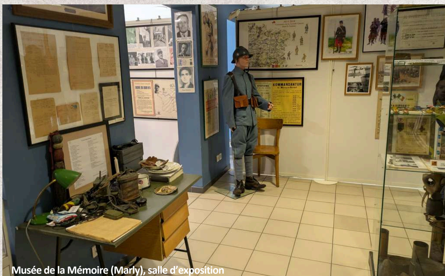
Musée de la Mémoire (Marly), salle d'exposition

Pour notre interlocuteur, il est essentiel de transmettre ce passé, afin que ces événements ne se reproduisent plus.