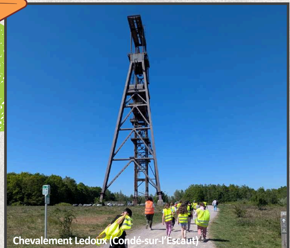
Chevalement Ledoux (Condé-sur-l'Escaut)

Découvrez le chant écrit par les Petits Explorateurs et partez en musique sur les chemins du souvenir.