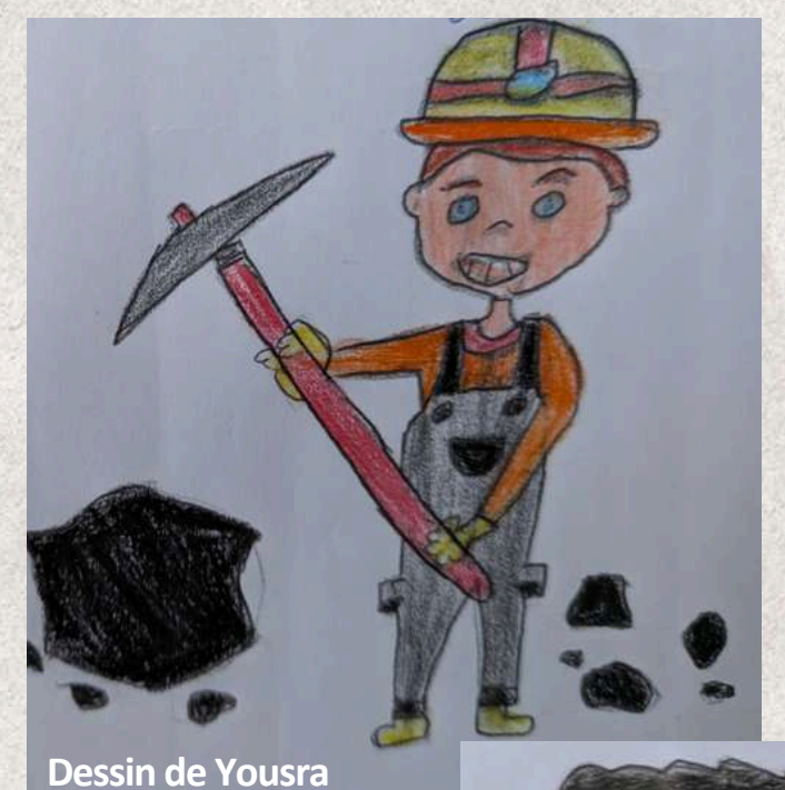
Dessin de Yousra

Corrigé: 1. Coron 2. Cheval 3. Lampiste 4. Terril 5. Galibot 6. Wagonnet 7. Mineur