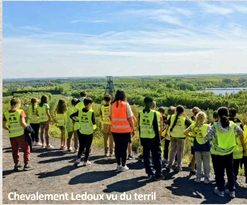
Chevalement Ledoux vu du terril

Les mineurs ou galibots y cherchaient du charbon. Il était chargé dans les wagonnets tirés par des chevaux. Le chevalement fonctionnait comme un ascenseur, il permettait de remonter le minerai et les mineurs l'empruntaient pour descendre ou remonter du fond. Les déchets de la mine forment une montagne appelée terril.