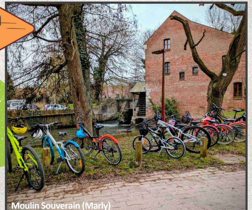
Moulin Souverain (Marly)