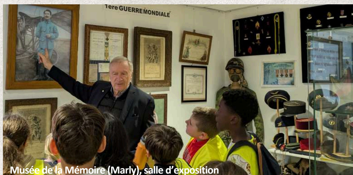
Musée de la Mémoire (Marly), salle d'exposition