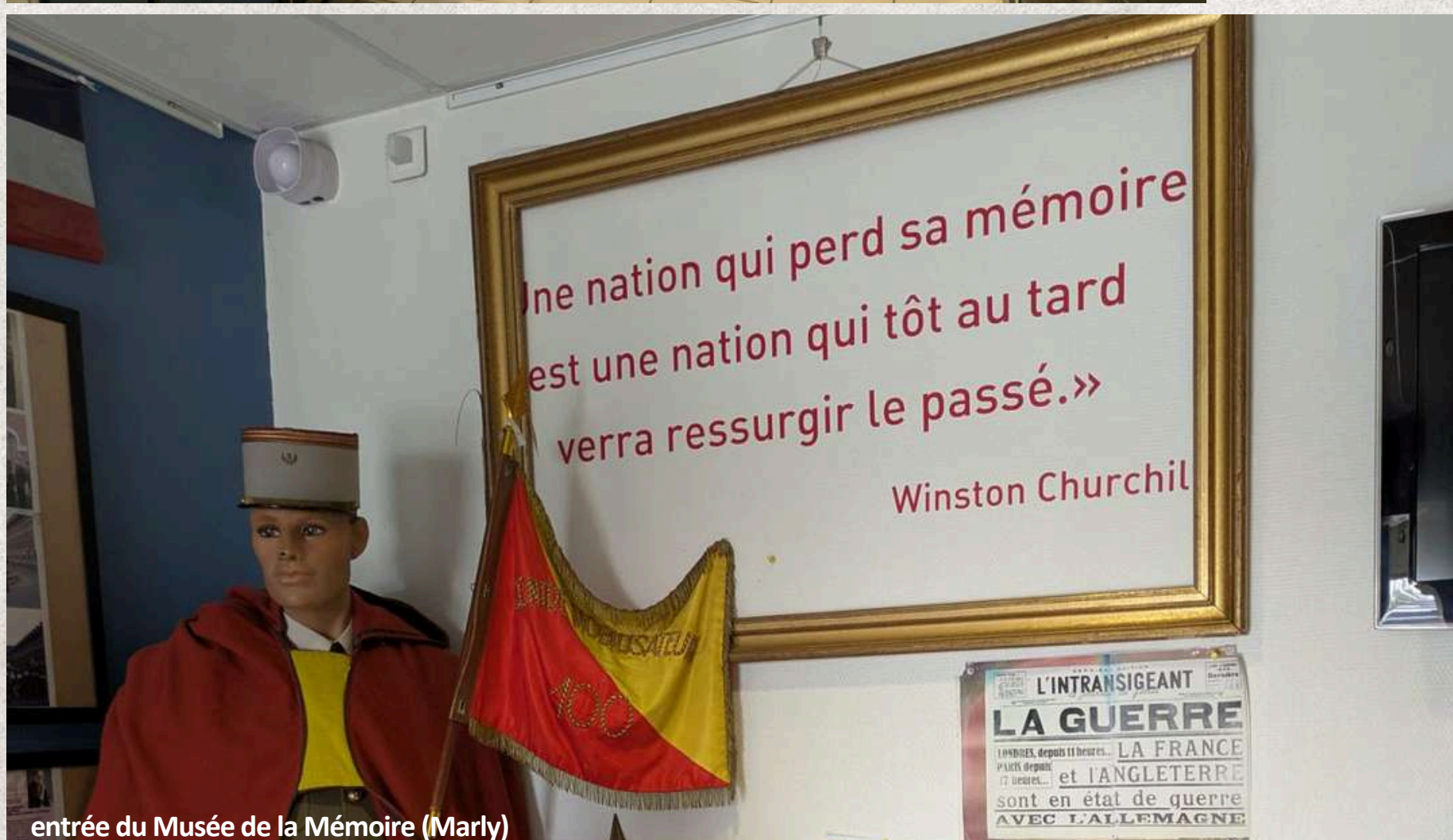
entrée du Musée de la Mémoire (Marly)