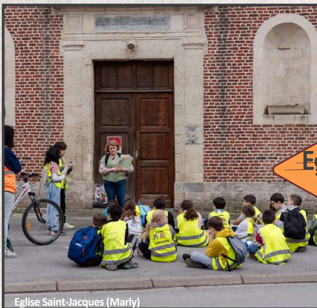
Eglise Saint-Jacques (Marly)