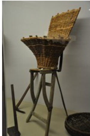
Hotte pour remonter la terre