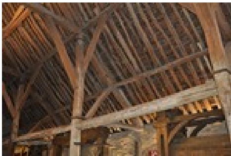
Le bois a l'intérieur et à l'extérieur des maisons et des hangars