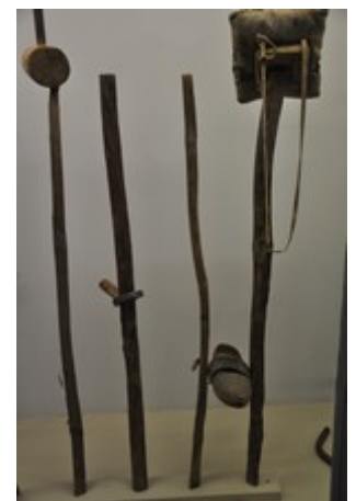
Échalas pour orienter les raisins vers le soleil et sabots en bois