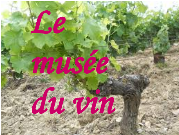
Le raisin pousse sur les ceps