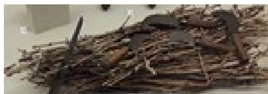
Manches d'outils en bois sur les fagots de sarments