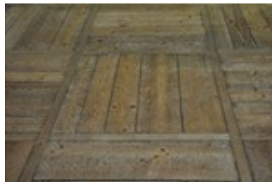
Même les sols sont en bois : parquets dans la maison du vigneron