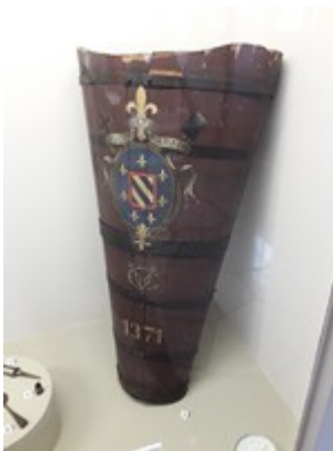
Hotte et pressoir