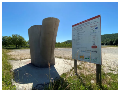
Le chantier de la déviation de Beynac, en mai 2020

" Cette décision constitue une victoire de l'environnement au sens large, c'est-à-dire de notre environnement architectural, paysager et notre patrimoine" dit-il.