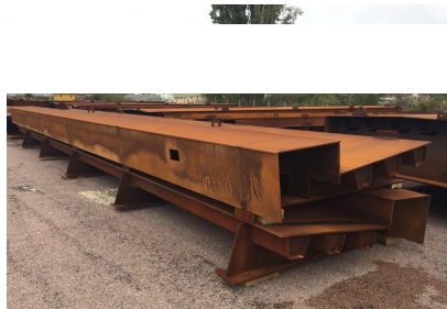
Les tabliers du pont du futur contournement de Beynac, ici stockés à Marsac en Dordogne, n'ont jamais pu être posés

Reste à savoir combien coûtera désormais la démolition des travaux déjà réalisés, et à combien se chiffrera la facture totale.