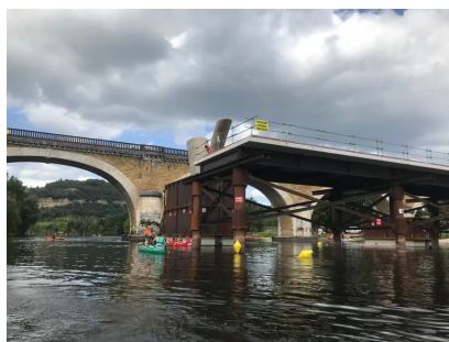
Le projet de contournement routier prévoyait la création d'une route de 3,2 kilomètres

Le conseil d'Etat n'a reçu aucun des trois recours déposés par le département. Or, le département avait besoin pour pouvoir construire que ses trois recours soient acceptés pour poursuivre la procédure en cassation. Le chantier de Beynac doit donc s'arrêter là.