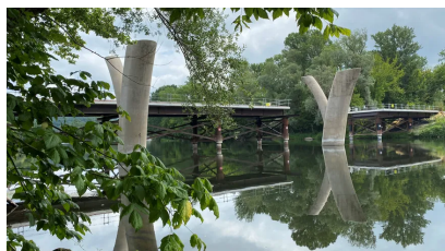
Les piliers déjà posés dans la rivière de la déviation de Beynac

Le conseil d'Etat a rendu sa décision : il n'a reçu aucun des trois recours déposés par le département de la Dordogne, suivant ainsi les conclusions du rapporteur public. Conséquence : le projet est définitivement enterré. La déviation de Beynac ne verra pas le jour