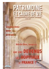
Les hôpitaux n°194