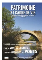
Les ponts n°195