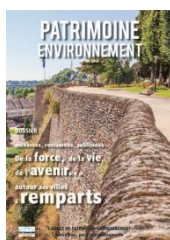
Les remparts n°196