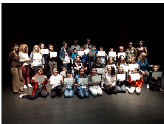
Prix Kléber Rossillon: 6e Pagnol du collège des 16 Fontaines à Saint Zaccharie