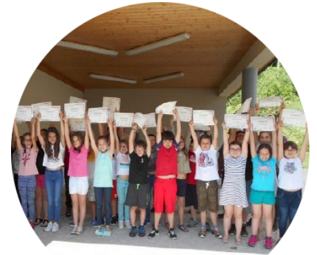
Les élèves de 5 ème du collège de Corrèze (lauréats 2017 du prix Arkéo)

La remise de chaque prix s'effectue dans l'école lauréate.