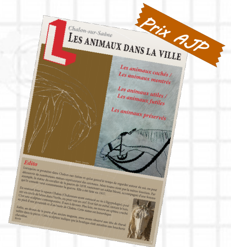
Les Unes des petits journaux lauréats en 2018