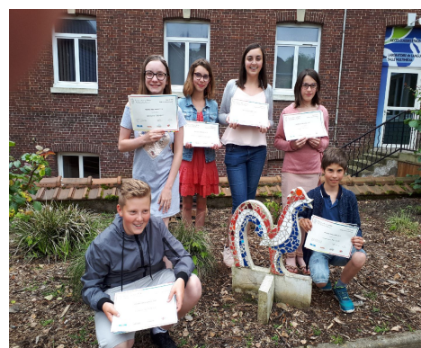
Prix Arkéo : 6e et 5e du collège La Providence de Nazareth à Eu