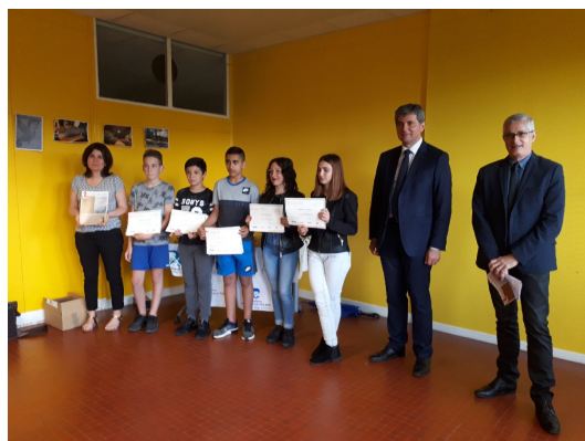
Prix AJP : classe relais Du collège Jacques Prévert à Chalon sur Saône