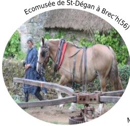
Ecomusée de St-Déjan à Brech (56)

Les 21 e Journées du Patrimoine de Pays et des Moulins ont rencontré un franc succès. Plus de 120 000 personnes se sont déplacées le week-end des 16-17 juin 2018.