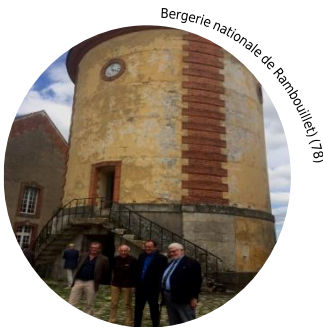
Bergerie nationale de Rambouillet (78)

Parrainée par Jean-Pierre Pernaut, cette 21 e édition avait pour thème "L'Animal et l'Homme".