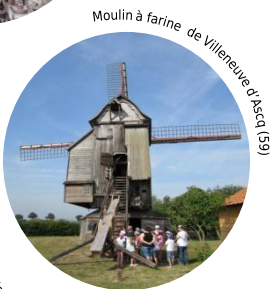
Moulin à farine de Lilleneuve d'Ascq (59)