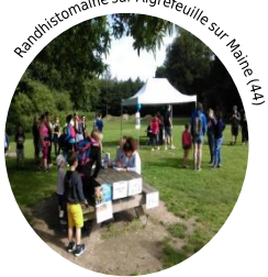
Randhistomaine sur Aigrefeuille sur Maine (49)