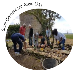
Saint-Clement sur Guye (71)