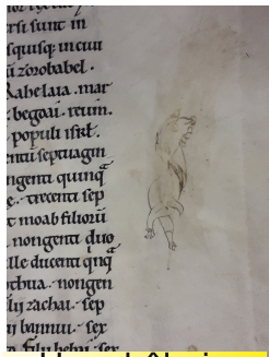
Une drôlerie ici un cochon.