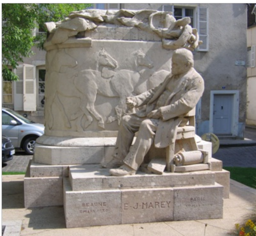
Statue de Jules Etienne Marey, né à Beaune

Des mouettes, des chevaux .... pourquoi ???? Car ce savant se passionnait par tout ce qui était en mouvement : la chronophotographie, le mouvement physiologique puis la locomotion humaine et animale