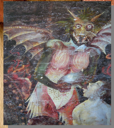
Détails du jugement dernier d'Albi XVe s avec des monstres terrifiants

La colère , l'avarice, la gourmandise, la luxure, l'envie, l'orgueil et la paresse sont les sept péchés. Sur l'œuvre, seul manque la paresse, qui devait se trouver en dessous du Christ à l'emplacement de la porte.