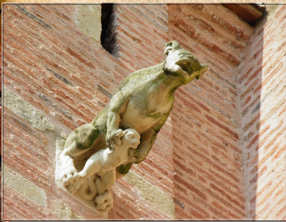
Gargouilles de la Cathédrale Saint-Alain à Lavaur XII-XIVe s

Aujourd'hui les gargouilles peuplent l'imaginaire. Ce sont des monstres qui apparaissent dans les romans ou les dessins animés ! Par exemple le roman Enola et les animaux extraordinaires , ou le Bossu de Notre Dame de Disney