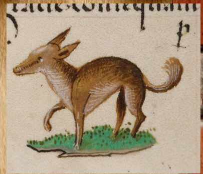
Enluminure datant de 1486-1506 du livre d'heure de Jeanne la folle, British Library avec des animaux courants

Certaines enluminures sont composées d'animaux représentant : une scène de chasse, des batailles entre animaux... Il y peut parfois avoir des animaux fantastiques ainsi que des animaux courants. Ces scènes racontent le quotidien des hommes à cette époque (La chasse) ou leur imaginaire (La licorne). Des animaux exotiques peuvent apparaître, ils font référence aux contrées lointaines (dromadaires)