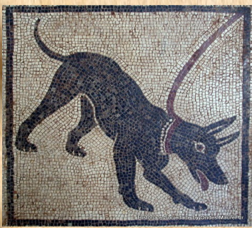
Mosaïque de chien découverte à Pompéi 1er siècle ap. J-C

Dans l'antiquité les animaux sont présents dans le quotidien des hommes et on les redécouvre dans les textes et les fouilles archéologiques. Ils sont légendaires comme l'hydre de Lerne ou sont des animaux du quotidien, comme les chiens et les oiseaux. Dans l'antiquité les animaux étaient représentés notamment sur des mosaïques.