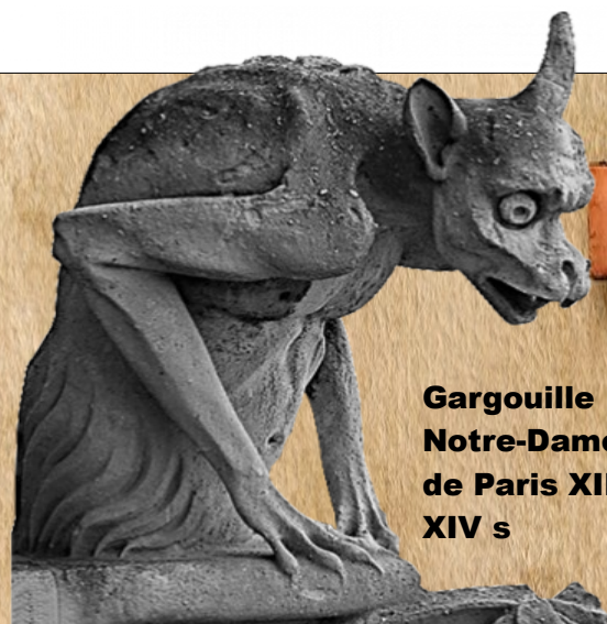
Gargouille Notre-Dame de Paris XII-XIV s