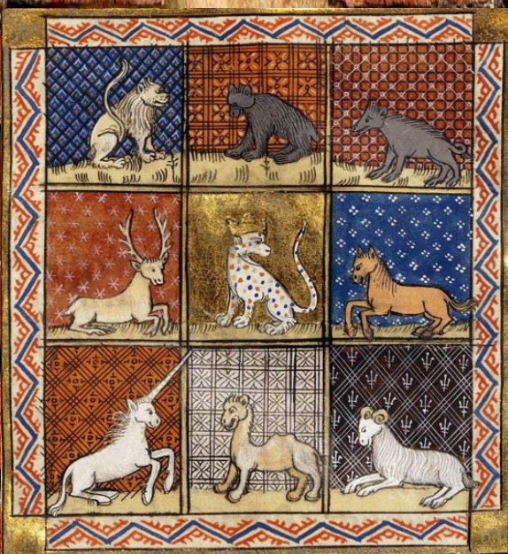
Enluminure de Barthélemy l'Anglais tirée du livre des propriétés des choses, XVe s

Les animaux sont omniprésents dans la décoration des manuscrits du Moyen Âge, surtout dans les enluminures. Une Enluminure au Moyen Âge est un dessin ou une illustration faite à la main, sur un parchemin en général.