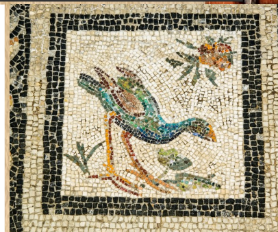
Mosaïque au sol de la Villa des oiseaux à Alexandrie en Égypte, au 1er siècle ap. J-C

Les mosaïques d'oiseaux et d'animaux de compagnie étaient très appréciées pour décorer les demeures.