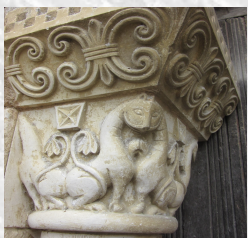
Oiseaux et lions des chapiteaux