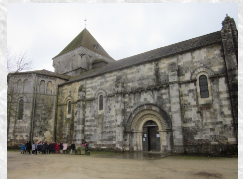
L'Eglise de Saint Maurice-la-Clouère

On a vu des chapiteaux avec des animaux dessus : il y avait des oiseaux avec des ailes qui faisaient un cœur. Sur l'arche qui est au-dessus de la porte, il y a beaucoup de lions ailés taillés dans la pierre.