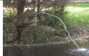
La fontaine « grenouille »

Les gens de Poitiers firent la fête tous les ans en baladant la statue de la Grand'Goule dans la ville et en fabriquant des gâteaux : « les casse-museaux » La Grand'Goule est un symbole pour les poitevins et sa statue est installée au musée de Sainte Croix à Poitiers.