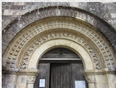
Animaux sculptés dans la pierre de l'arche