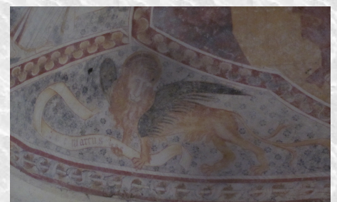
Lion ailé au-dessus de l'autel