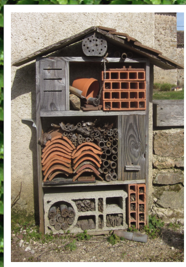
Hôtel à insectes vu lors de notre classe verte