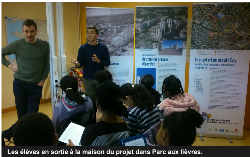
Les élèves en sortie à la maison du projet dans Parc aux lièvres.