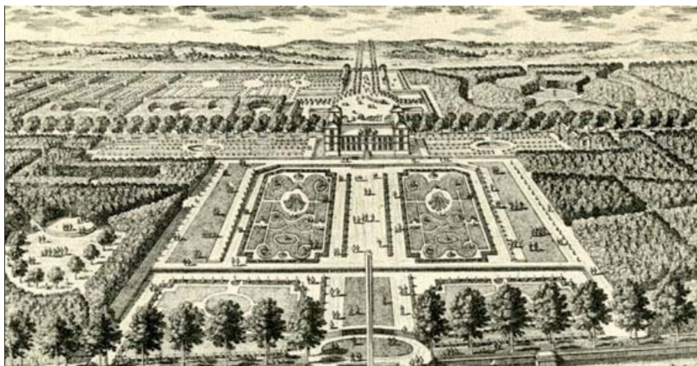
Gravure des jardins du château de Petit Bourg, Archives départementales de l'Essonne.

ARCHIVES: Les photos, les vidéos, par exemples, sont des documents conservés minutieusement, appelés archives. se situent à Chamarande.