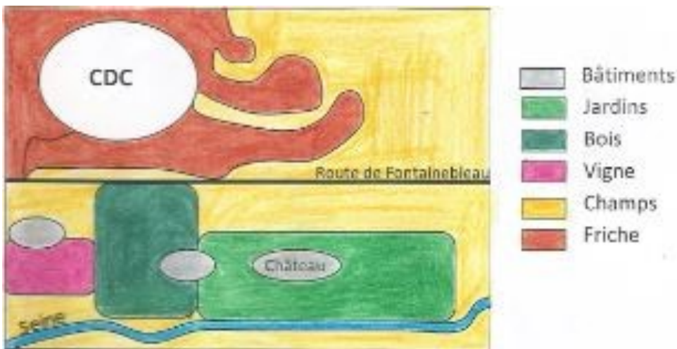
Schéma d'Evry au début du XIX e siècle d'après le plan d'intendance.