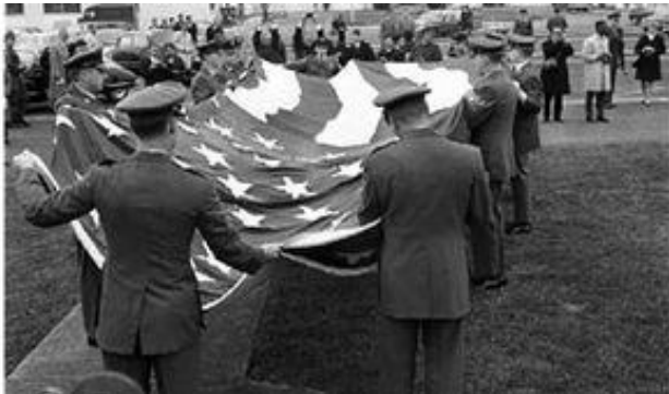
Cérémonie de départ des Américains