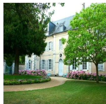
George Sand et son domaine de Nohant