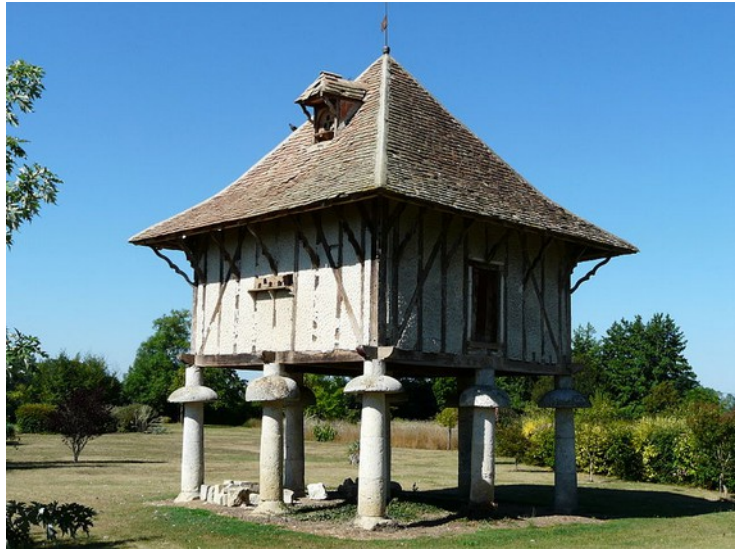
Pigeonnier sur colonnes du manoir du bout du pont, Agnac, Lot-et-Garonne

Dans le Lot-et-Garonne, on trouve de nombreux pigeonniers. Les pigeons ont été élevés pendant des milliers d'années, pour de nombreuses raisons.