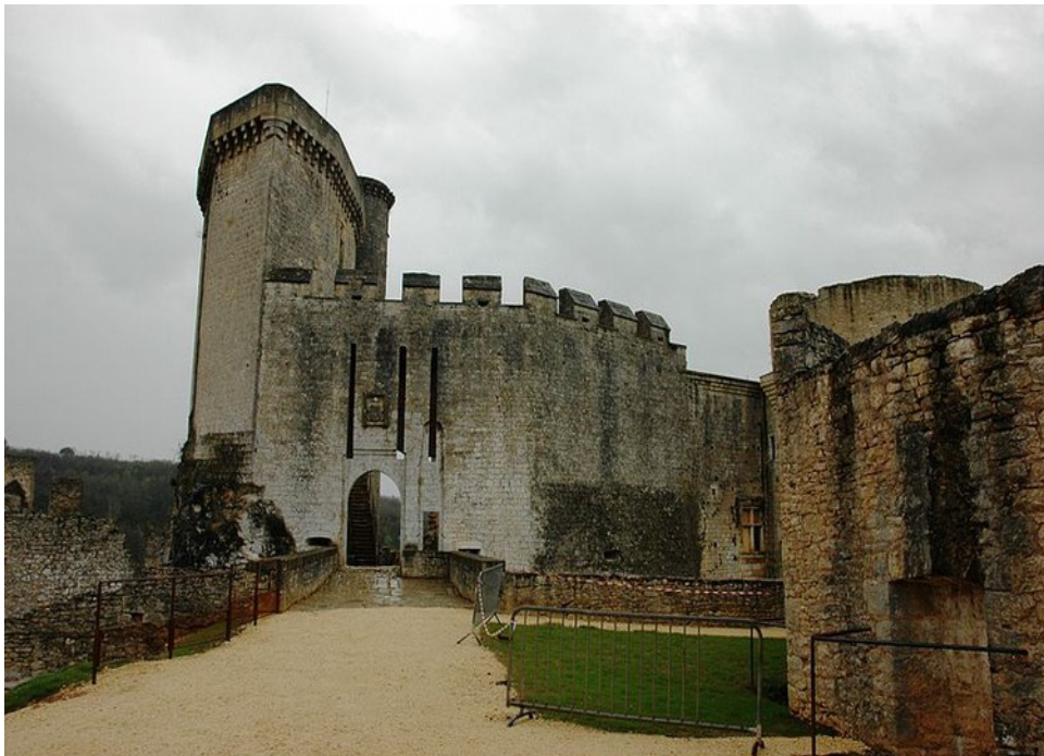
Le château de Bonaguil et l'emplacement du premier pont-levis