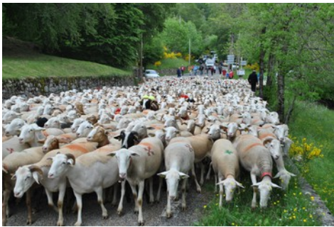
La transhumance des moutons

C'est avant tout une fête. Le public est invité à cette fête très ancienne.