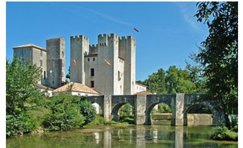
Le pont roman et le moulin fortifié

Le Moulin des Tours, qui se situe à Barbaste, dans le Lot-et-Garonne, sur le territoire de la commune de Nérac, se trouve sur la rive droite de la Gélise.