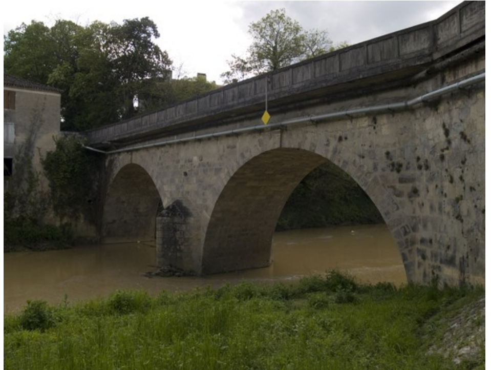
Pont de Bordes

Le pont de Bordes; la transhumance; les pigeonniers; Bonaguil; Barbaste; les mottes