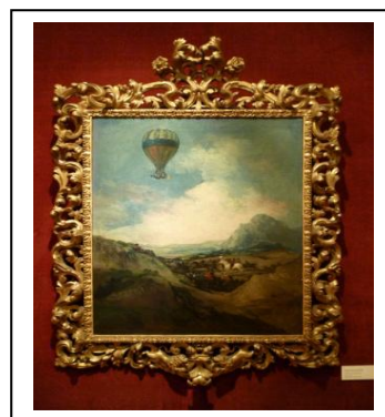
« Le Ballon » aérostatique du peintre espagnol Francisco Goya (1748-1828)