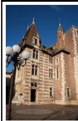
Musée des Beaux-arts d'Agen.