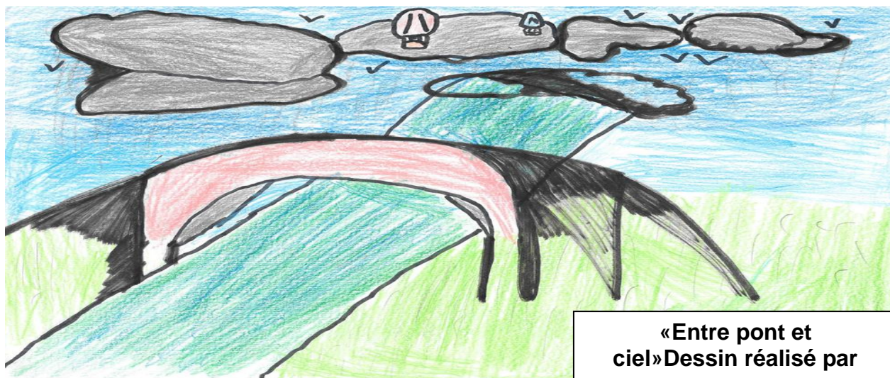
«Entre pont et ciel» Dessin réalisé par