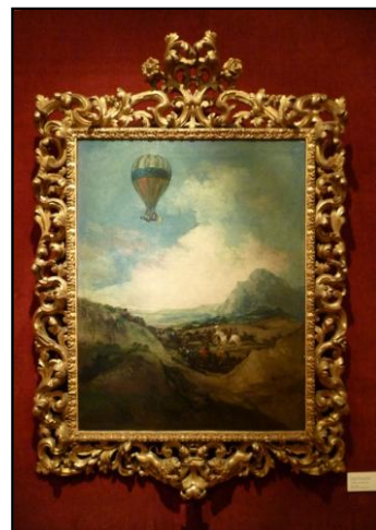
« Le Ballon » aérostatique du peintre espagnol Francisco Goya (1748-1828)