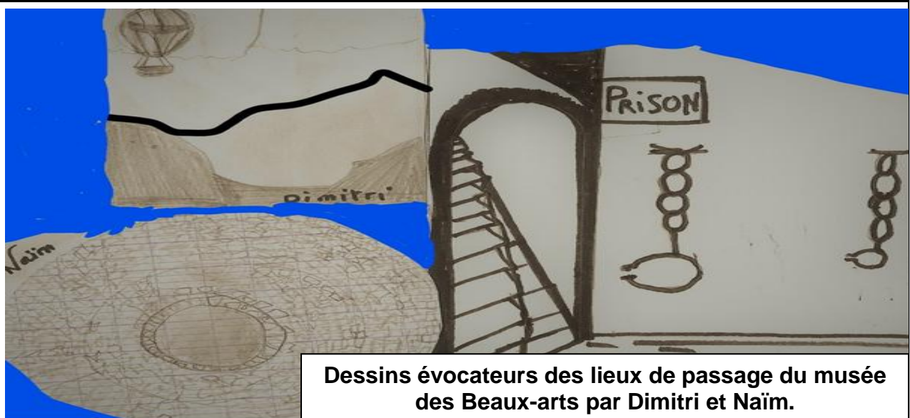
Dessins évocateurs des lieux de passage du musée des Beaux-arts par Dimitri et Naïm.