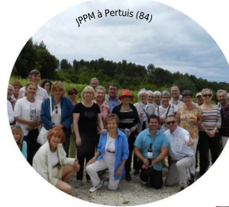
JPPM à Pertuis (84)

90% des organisateurs veulent réitérer leur participation pour la prochaine édition!