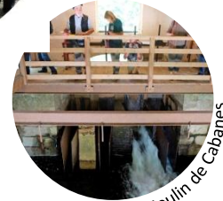
Visite au Moulin de Cabanes