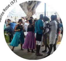
Sainte Rose (97)