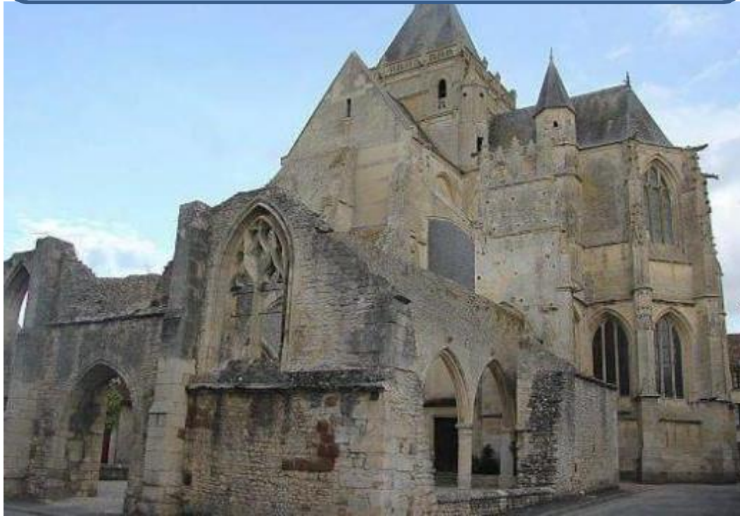
L'Eglise Notre Dame (ci-dessus).

Nous avons été surpris d'apprendre tant de choses passionnantes sur notre vieil Ecouché ... Lisez notre reportage photo pages 2 et 3.