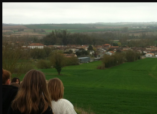
La motte féodale, sur le chemin menant au Château d'eau