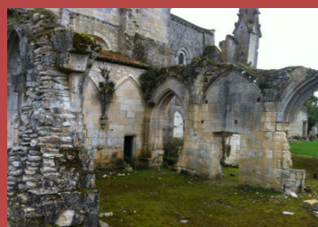
Le passage du temps...