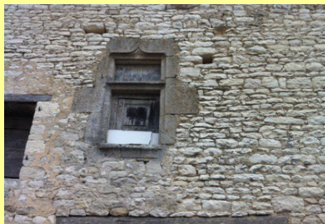
Porte et fenêtre du Moyen-âge de la plus ancienne maison de Marcillac