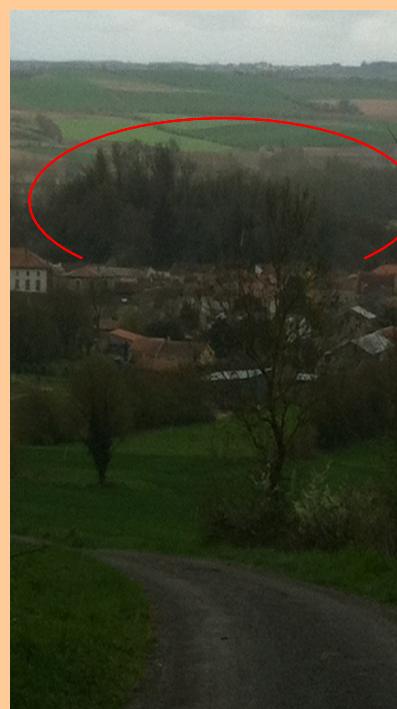
Un monument de Marcillac : Le Château

La motte féodale située non loin de la Charente