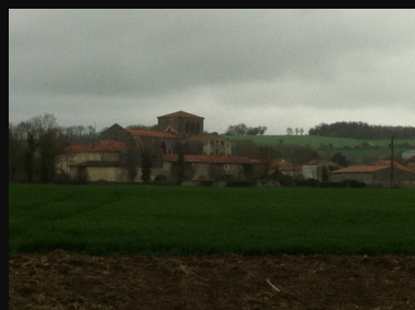
L'abbaye de Lanville

Du haut de notre village, nous observons une motte féodale sur notre gauche. Elle semble couronner nos demeures... Il nous suffit de balayer du regard ce paysage pour qu'on s'accroche aux contours massifs de l'abbaye de Lanville datant du XII ème siècle.