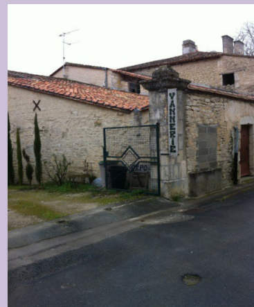
Une vannerie à Lanville...